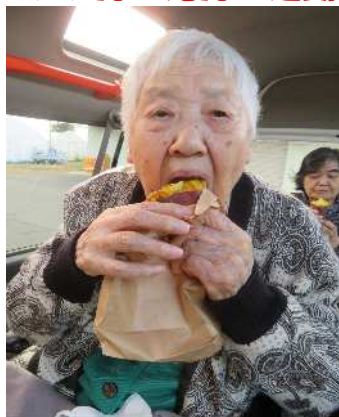
あ～むっと食べるのさっ！