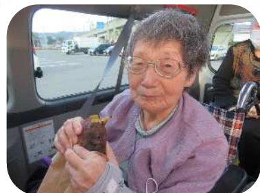
甘くてとっても美味しいよ～♡

食欲の秋🍁ということで、今年はさらきの里ふれあいセンターに焼き芋ドライブに行ってきました！紅あずま、紅はるか、安納芋、シルクスイートなど種類も豊富でサイズも小、中、大、特大から選べました♪今回は紅はるかの中サイズを注文。お味は…ねっとり甘味があって食べる口が止まらない♡「美味しい」「幸せ♪」と皆様とても喜んでいただきました！来年もまた行きましょね！あっという間に今年も残り1ヶ月ですね。インフルエンザ等感染症も流行っている所以体調には気を付けていきましょう。