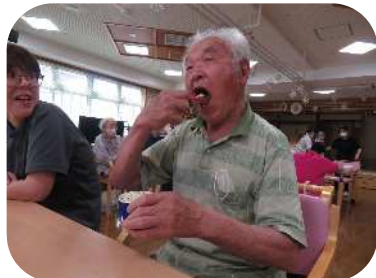
クッキー&クリーム美味しい♪

今年も七夕飾りを作り写真撮影を行いました！今年は仙台七夕をイメージして長期間かけて作成。デいの夏祭り、法人の秋まつりにも飾ろうと思います♪皆様には短冊も書いてもらいましたが、今年は「世界平和」「デいに元気に来られますように」が多かったです！戦争のない世界と、皆様の健康を職員も願っております☆これからも元気にデいにいらしてください！アイスイベントではサーティワンアイスを楽しみました♪一番人気は黒蜜入りみたらしアイス🍧でした！また食べたいですね♪