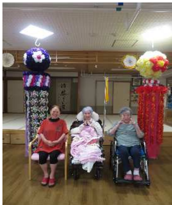
今年の七夕飾りも大作です！！