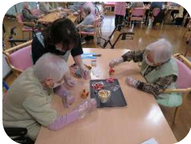
何をトッピングしようかな～☆

3月は桃の節句行事 🍡 今年も衣装に着替えて写真撮影会を行いました ✨ とても似合っていますね！ 凛々しいお内裏様と綺麗なお雛様の素敵な写真となりました ♪ おやつ作りでは先月に続けていちごパフェ作りをしました 🍓 いちごのへたを取る、バームクーヘンを切る、生クリームとアイスもカップに入れていただきました。こっそり生クリームをマシマシに入れる方も(笑) 令和7年度も沢山の行事を開催するので楽しみにしていて下さい ♪ 4月はお花見ドライブに行きますよ～ 🌸