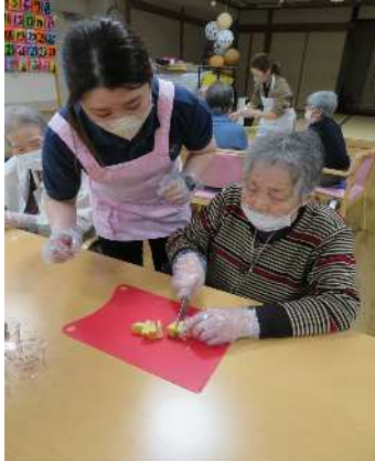
この包丁さばき流石です！