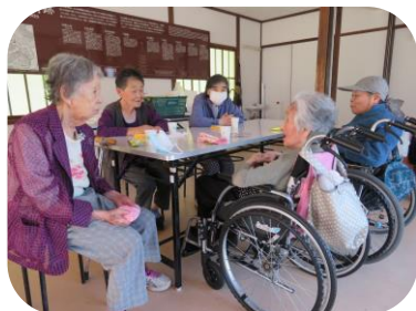
一服タイム♪話が弾みます！

爽やかな空気と新緑を見てリラックス効果！ ということで、国見山にドライブに行ってきた。 お茶とおやつを持って国見山休憩所へ出発。 車内では話が弾み自然と表情は笑顔になりました！ 休憩所に到着しおやつタイム😊初めてドライブに参加した方もいて、休憩所内でも色々なお話をして盛り上がりました♪休憩所上の鐘を今年も「ごーん、ごーん♪」と撞いて健康で過ごせるようお参りしてきました！皆様ご参加ありがとうございました。6月の行事は駄菓子屋さんを予定しています。お楽しみに♪