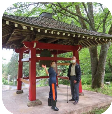
新緑で森林浴♪空気も爽やか