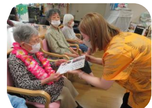
～7月の誕生者は4名でした！ハッピーバースデー♪～