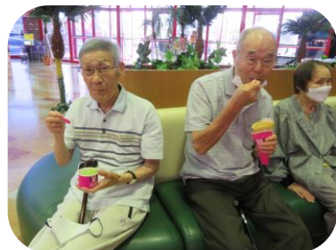
アイスとクレープどちらも最高♪

デイサービスは8月14、15日お盆休業となります。皆様にはご迷惑をおかけしますが、ご理解の程よろしくお願いたします。