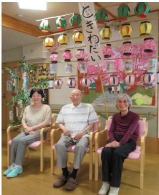
セタ写真撮影の様子です！

7月17日からアメリカンワールド内にあるサーティワンにアイスドライブに行ってきました！現地に行って食べるのも4年ぶりで、ドキドキしている方もいたようです♪今回はアイスとクレープ好きな方を選んでいただきました。「外に行って食べるアイスやクレープは美味しいね！」と皆さん表情もニコニコ♪外出はやっぱり楽しいですね！来年もお楽しみに♪