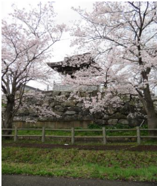
江釣子全明寺の桜です🌸

今年は気温が暖かくて桜が10日程早く咲きました🌸ドライブも予定より早まりバタバタしましたが、天気の良い日はお団子も持参して全明寺の駐車場で食べることができました！味はみたらし、ずんだ、あんこの三種類🌸毎年好評ですが美味しかったですか？来年も桜の木の下乾杯してお団子を食べましょう♪さて、ピンクの桜も最高ですが、緑色は目や心に良いそうです！ということで、5月は新緑ドライブに行く予定です。リクエストもあったので久々に展勝地方面に行こうと思います！お楽しみに♪