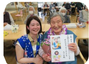
～4月の誕生者は4名でした！ハッピーバースデー♪～