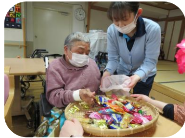
沢山取ってくださいね！

今年も鍋週間の季節 となりました！今年は 餃子、とんこつ、石狩 鍋の3種類を2日毎に 変更して楽しんで頂き ました♪今年のお鍋の 味はいかがでしたか？