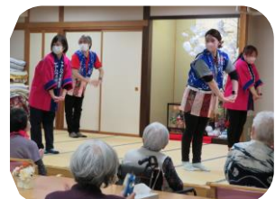
～2月の誕生者は6名でした！Happyバースデー～