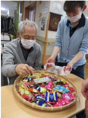
バレンタインお菓子すくい♪

節分行事から始まりバレンタイン、鍋週間と 楽しいイベントを実施しました♪節分行事で は2匹の鬼に向かって「鬼は～外、福は～内 ♪」と元気に豆を投げました！最後は鬼が土下 座で謝っていましたね(笑)バレンタイン行事で は色々なお菓子が沢山！これは悩みますね！狙 ったお菓子をすくうことはできましたか？最後 は鍋週間です。毎年3種類の味をご用意し楽し んで頂いています。今年は初めて、とんこつ鍋 に挑戦！なかなか評判は良かったですね。来年 はどんな鍋になるのか！ご期待ください♪