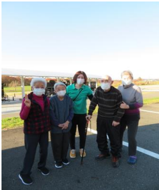
秋晴れの展勝地で記念撮影♪

11月7日～12日に「市内をぐるっと見学！紅葉を見に行こうよう！！」と題してドライブに行ってきました。詩歌の森、展勝地、サトウハロー記念館から稲瀬方面に抜けて紅葉を見してきました！オレンジや赤、黄色に色づいた木々はとても綺麗でしたね♪久しぶりに市内を回ると新しい建物が沢山あり「こんなになっているとは思わなかった」とびっくりされている方もいました。これからさらに寒くなり雪も降ってきます。体調を崩さないよう暖かくして過ごして下さい！そして元気にデイにきて下さいね♪