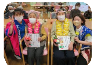
～11月の誕生会は5名でした！ハッピーバースデー～