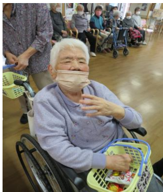
どれにするか迷っちゃう！

5月は駄菓子屋イベントを開催！今年はお菓子の種類を増やしてみました。懐かしいお菓子が沢山で「どれにするか悩む～」と楽しみながら迷いながら選んで頂きました。今年も有難いことに完売！「来年はもっと沢山購入したい」との声もありました。さらに楽しめるよう色々検討していきたいと思います。ご参加の皆様本当にありがとうございました♪駄菓子屋さんと一緒にいられた輪投げ大会の様子も右下にありますので、ご覧ください。来月からも楽しい行事を計画しておりますので、お楽しみに☆