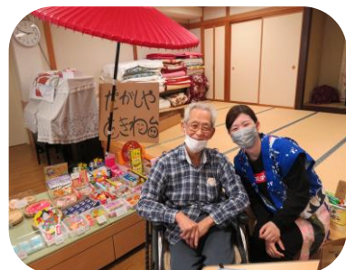
駄菓子屋ときわ台！今年も出店♪

去年より飲み物の種類も増えました！中でも一番人気がこのコーラで価格が40円！メジャーリーグのO谷さんも飲んでるとセンター内で噂が流れ、気が付いたら売り切れに笑 →