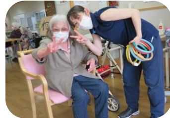
駄菓子屋イベントと一緒に輪投げも行っていました！高得点の方には景品もプレゼント♪