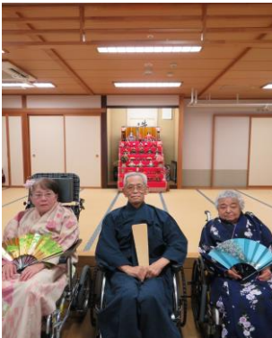
おだいひさ～まとおひなさま♪

衣装に着替えて撮影会♪お内裏様もお雛様も似合っていますね！お化粧品もして素敵な写真を撮ることができました。寿司の日はとても好評で「おいしい～」とおかわりをされる方も！次回開催もお楽しみに♪ガラススタイルコースター作りでは、自分で好きなタイルの色を選んで集中して作って頂きました！とても上手に完成できたので、ご自宅で使ってみて下さいね！