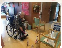
運動も頑張ってます!!