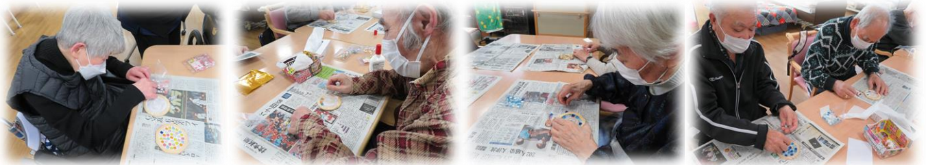
・「何色のタイルにしようかな」「こんな模様になりたい」など色々お話ししながら楽しんで作って、世界に1つだけのコースターになりました♪