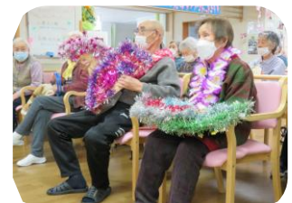
～3月の誕生者は7名でした！ハッピーバースデー～