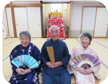
衣装もバッチリ決まっていますね！

現在もコロナ感染率が非常に高い状態です。引き続きご利用者様、ご家族様で体調不良や濃厚接触、帰省等がある場合は当事業所まで必ずご連絡をお願い致します。