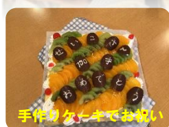
手作りのケーキでお祝い

活動で雑巾作りを行っています。その雑巾に使用するタオルを集めています。ご家庭で不要なタオルがありましたら寄付をお願いいたします。（使用済み可）宜しくお願ひ致します。