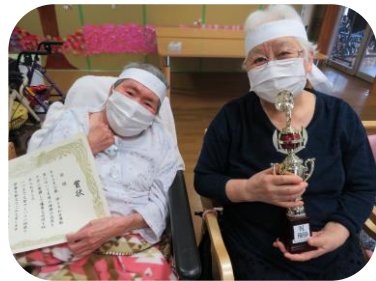
優勝おめでとうございます♪

スポーツの秋！食欲の秋！今年もこの季節がやってまいりました！運動会では、白軍紅軍に分かれて1週間真剣勝負。勝負綱引きと皆で玉入れ競争を行い大変盛り上がりました！次の週には芋の子昼食会を1週間実施しました。今年も味噌味が人気でしたが、おかわりで醤油を食べると「こっちも美味しい」と笑顔で教えてくださいました♪来年も楽しみにして下さいね☆ 感染者数が減少していますが、引き続き他県往来、接触される場合は当事業所へご連絡をお願い致します。また今後予防策（マスク、消毒）の徹底をお願い致します。