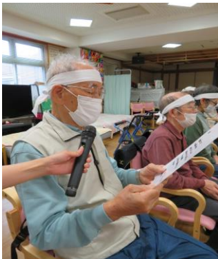
選手宣誓で気合が入ります！