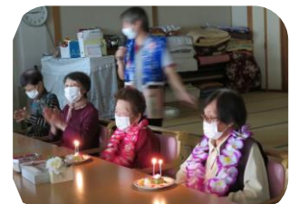
～9月の誕生者は3名でした！ハッピーバースデー～