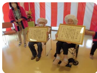
白寿のお二人には国から表彰状が届きました！

9月17日、長寿を祝う会を行いました。今年の賀寿者は7名でした。白寿2名、卒寿3名、米寿2名。常心の里の最高年齢は101歳です！今年度100歳を迎えられるお二人も、先輩に続け！とまだまだ元気にご過ごされています。コロナ禍で大変なことも多いですが、入居者の皆さんがひとつ屋根の下でこれからも安心して元気に長生きできるように、お手伝いしていきたいと思えます。施設から、ささやかではありますが居室担当の手作りメッセージカードと写真立てをお贈りいたしました。