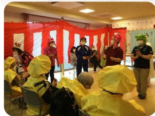
職員之余興で賑やかに♪