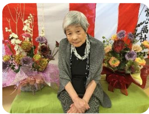
皆様おめかしされて参加しましたよ。