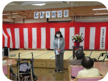
皆様おめでとうございます！

引き続き他県往来、接触される場合は当事業所へご連絡下さい。積極的なワクチン接種ありがとうございます。今後も予防策（マスク、消毒）の徹底をお願い致します。