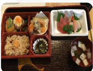
お祝い膳 お刺身は好評でした😊