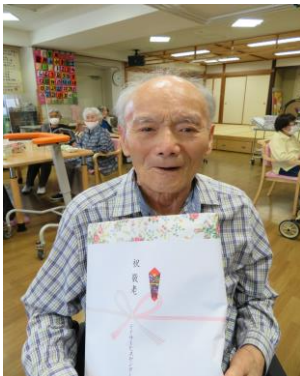
卒寿おめでとうございます♪

9月14日から敬老お祝い週間、9月20日に長寿を祝う会を開催しました。今年度のお祝い該当者は7名でした！皆様おめでとうございます♪現在のデイ利用者最高年齢は97歳の方です！これからも『笑顔いっぱい、幸せいっぱい、ハラいっぱい』で元気に健康でデイサービスをご利用下さい！お待ちしております。10月行事は芋の子週間があります。お楽しみに！