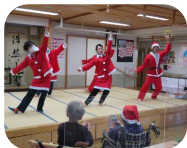
ジングルベル🔔クリスマス会

明けましておめでとうございます！ご利用者、ご家族様今年もよろしくお祈りします。昨年から大変な状況が続いておりますが、このような時だからこそ、皆様が少しでも笑顔で楽しい時間を過ごして頂けるよう感染対策も徹底しながら職員一同努めて参ります。昨年末にお渡ししたクリスマスカードとしめ縄はいかがでしたか？感想を聞かせて下さいね☆