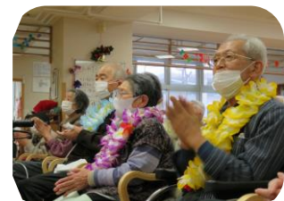
～12月の誕生者は7名でした！Happyバースデー～