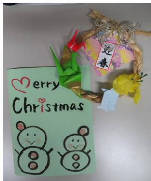
皆様へ☆プレゼント

明けましておめでとうございます！ご利用者、ご家族様今年もよろしくお祈りします。昨年から大変な状況が続いておりますが、このような時だからこそ、皆様が少しでも笑顔で楽しい時間を過ごして頂けるよう感染対策も徹底しながら職員一同努めて参ります。昨年末にお渡ししたクリスマスカードとしめ縄はいかがでしたか？感想を聞かせて下さいね☆