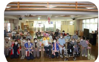
～8月の誕生者は5名でした！ハッピーバースデー～

ニコニコ笑顔で最高の誕生会になりました☆誕生会の最後には誕生者の方に挨拶もしていただきました♪