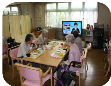
飛沫防止対策を行っています

コロナウイルス感染症について、予防対応策が変更の際は都度お知らせします。現在は飛沫防止対策のため食事の際はアクリル板を使用しています。ご迷惑をおかけしますが、ご理解とご協力のほどよろしくお願い致します。