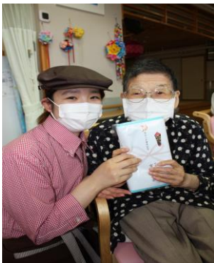
20周年記念タオルです☆

8/31に法人設立20周年を迎えました。コロナウイルスで不安な日々を過ごす中、久しぶりに明るい話題になったと思います。ご利用者の皆様には記念のタオルをプレゼントさせて頂きました。ご自宅で使って頂けたら嬉しいです。今後もご利用者様ひとりひとりに合わせたケアに努めて参りますのでよろしくお願い致します！