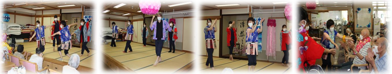
・憧れのハワイ航路と三味線7ギウギを踊りました！皆様も拍手や一緒に手踊りをして盛り上げてくれました！感謝です☆