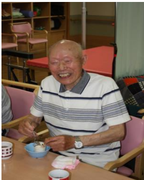
いい男とアイスクリーム☆

先月の駄菓子屋さんにつき、センター内行事第二弾となるアイスイベントを開催しました！味はバニラ味を用意して、その上に好きなトッピングやソースをかけて楽しんで頂きました☆ソースを決めるのは皆様悩んでいましたね(笑)初めて行いましたが、とても好評でした。来年は外にアイスドライブに行きましょうね♪