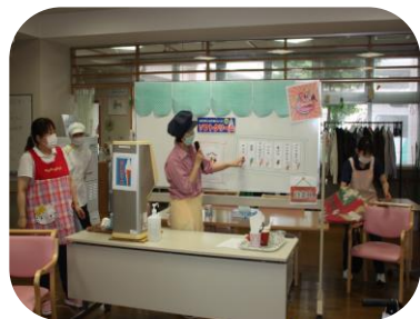
メニューを紹介！迷いますね～

コロナウイルスの新規感染がまた増加傾向になっています。いまだ終息に至っておらず、治療法も確立していません。当事業所では引き続き予防策を継続します。ご協力をお願いいたします。