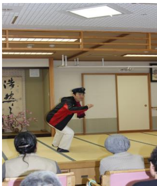
マドロスの披露に拍手喝采！

こんな状況だからこそ楽しめる時間を！外出しなくても、やれること楽しいことは沢山あるぞ！ということで、毎年好評の三色団子を室内で食べてお花見気分♪を満喫しました。お花は隣に座る仲間たち皆様、職員一緒に笑って過ごしました☆5月も新しい行事を考えていますので、皆様で感染予防をしっかりと行い、コロナに負けず頑張っていきましょう！！