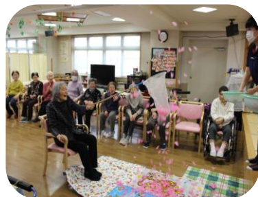
室内で桜の花びらゲーム☆