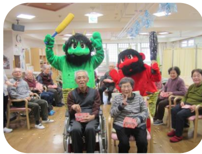
みずきに花を咲かせましょ♪

ご利用者様及びご家族様には新型コロナウイルス感染症対策のご理解とご協力誠にありがとうございます。引き続き予防策を継続しますのでよろしくをお願いします。