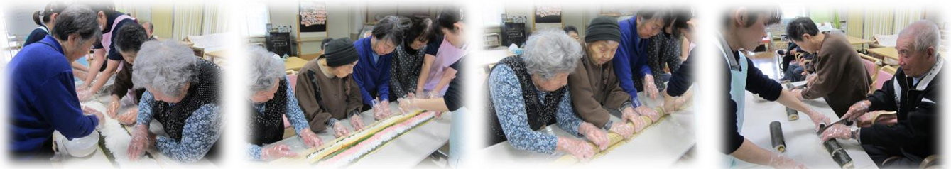
・恵方巻きが徐々に出来上がっていきますよ！今年は今までで最高の1m6cm！切るのがもったいないねと皆様笑ってお話していました☆

2月の一コマ～1日に恵方巻き作りをしました。今年の恵方巻きは1m6cmでしたよ～☆