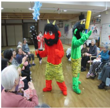
常盤台から来た鬼だぞ～！

今年も常盤台から2匹の鬼が来ましたよ～！ 鬼に勢いよく「鬼は～外、福は～内」と豆を投げると、たまらず鬼も謝って帰っていきましたね（笑）鬼さん2匹は汗だくで息が上がっていたとか何とか…。季節の行事大成功でした！他にも、鍋週間や恵方巻き作りなど色々実施しております☆来月の行事にもご期待ください♪