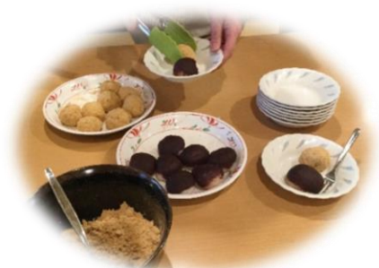
2/16 おはぎ作り☆きれいに丸めて、あんこときなこの2種類！ みんなの分も作っておやつで美味しくいただきました♪