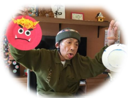
鬼のお面でおどかさぞ～！！