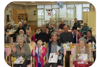
～2月の誕生会は6名でした！ハッピーバースデー♪～