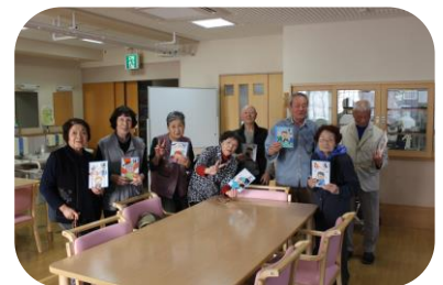
新春カルタ取り大会。特殊サギ防止に関わるカルタに関心も深めました。