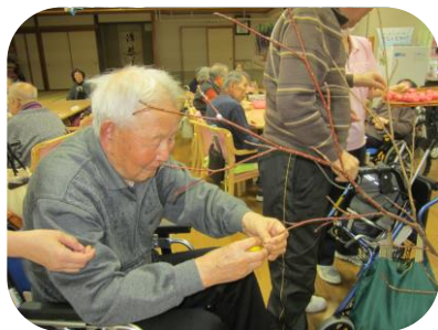
みずきに花を咲かせましょ♪