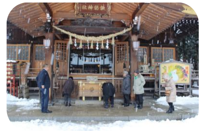
初詣~地元諏訪神社へ行きました。一年間お守りください。