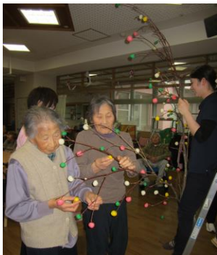
どこに付けようかなあ～

今年は本当に雪が少ないですね。雪かきをすることがなく助かりますが、暖冬のため空気が乾燥しやすくインフルエンザ等の感染症が流行しやすいので皆さま注意していきましょう。