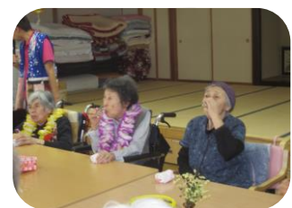
～9月の誕生者は2名でした！ハッピーバースデー♪～