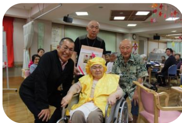
記念品贈呈 (理事長より)