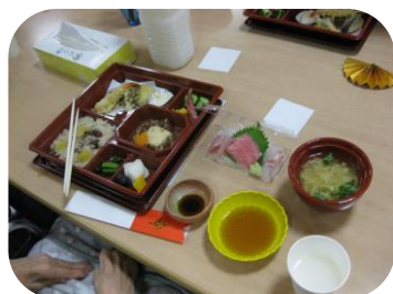
お祝い御膳(左) お刺身は菊寿司様 より提供(感謝)

9月22日(日) 11:30～デイセンターを会場に長寿を祝う会を開催しました。今年の賀寿者は3名(卒寿2名、米寿1名)それぞれにお祝い品が贈られました。乾杯の後、北藤根鬼剣舞の勇壮な舞に「すごいすごい、子供もかわいいねえ」と拍手でした。職員の余興も業務の合間をみて練習した成果が発揮され手拍子の中で楽しみました。お刺身付きの御膳にお腹も心も満足した時間となりました。健康長寿を祝い改めて皆様おめでとうございます。