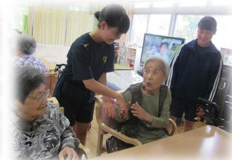
・北上合唱アカデミー様の慰問♪今年職員とコラボレーション！踊りは満州娘でした☆