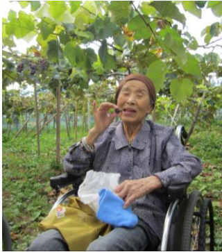
大粒で表情もニコニコ笑顔☆

季節の行事ぶどう狩りに今年も三浦ぶどう園に行ってきました。ここでしか食べられない品種のぶどうに皆様「甘い！」とあっという間に一房を完食！楽しそうな笑顔と美味しそうな表情をたくさん見せてもらいました。来年もぜひ参加して下さいね☆さらに9月は敬老週間がありました。9/10～16日まで昼食はお赤飯、敬老のお祝いの粗品をプレゼントさせていただきました。99歳白寿の方が2名いるので来年は盛大に100歳記念行事も考えています。10月は芋の子会、紅葉ドライブです！お楽しみに♪