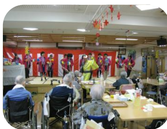
職員の余興 マツケンサンバⅡ みんなノリノリで盛り 上がりました。