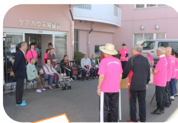
交流と親睦も深め頑張ってます