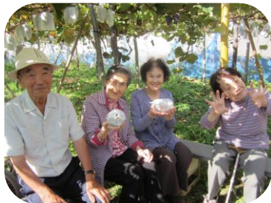
あま～いぶどうに大満足♪