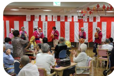
職員余興 (花笠音頭) 手拍子×2