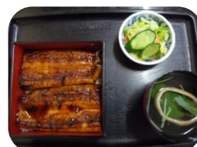
「やぎや」にて暑気払い (7/10) うなぎパワーで元気×2