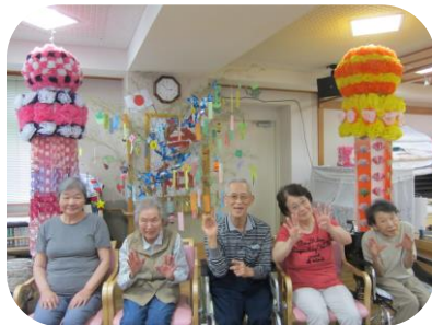
飾りも表情も素敵ですね！