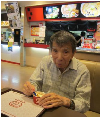
去年とは違う味です！

7月27日に令和記念地域交流夏祭りを行いました。ご来場下さいました方々、バザー等に協力して下さいました方々に感謝いたします。夏祭りに披露する七夕飾りを皆で協力して作成しました。今年は仙台七夕祭りをモチーフにサイズの大きな飾りが完成！ピースで記念撮影☆アイスドライブ&おやつ作りもありました。8月の行事も沢山あるので乞うご期待下さい！