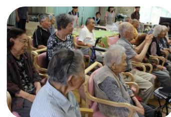
手風琴ごまの会様 (7/1)