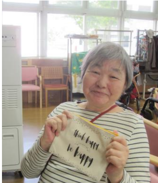
私はこれにしました！

5/27～6/3までダイソー村崎野店へ買い物ドライブに行ってきました。一番人気だったのは靴下です。「100円でこんな良い物が買えるなんて凄いね」と喜んでいました。他にもスカーフやマグカップ、お花用のプランターなど欲しかった物を購入することができたでしょうか？また計画しますので次回も参加してくださいね！6月は毎年大好評のアイスクリームドライブを後半に予定しています。近くなりましたらお知らせを帳面にはさみますので皆さまお楽しみに～☆