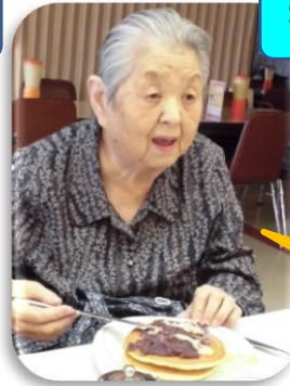
花巻マルカン大食堂チーム