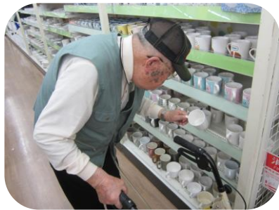
沢山あって迷います～☆