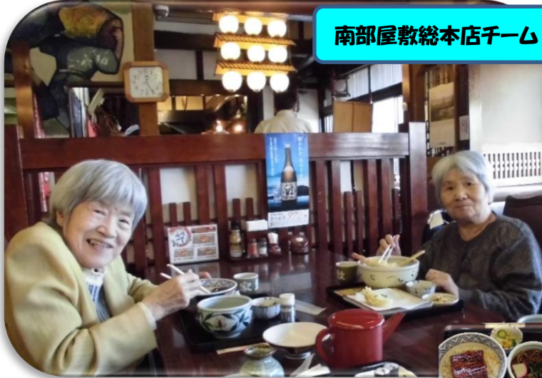
南部屋敷総本店チーム