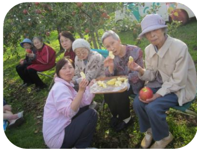
とってもおいしいよ～♪