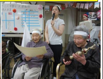
新聞紙徒競走～皆様とても速かったです！ ペットボトルタワー倒し早い日は3秒で倒しました笑 最後は表彰式を行いました☆