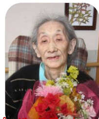
～10月の誕生者は4名でした！ハッピーバースデー～