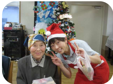
Xmasカード&しめ縄の音