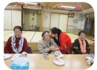
～賑やかな誕生会となりました～