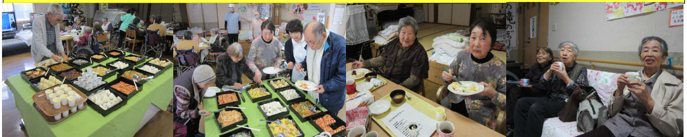
どれを取ろうか迷っちゃう!? いつもより食量も増えていますね☆ 「おいしいなさあ～♪」 少し休憩～ホッと一息