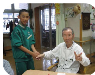
北上北中職場体験～9/28,29 体操レクにも参加しました！