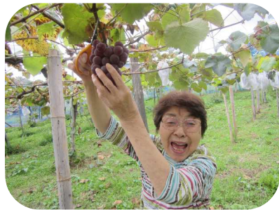
このぶどうに決めました！！