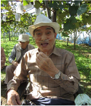
あま〜い！表情もニコニコ☆

毎年皆様から好評のぶどう狩りに今年も行ってきました。おいしいぶどう一房をあっという間に食べる方もいて、今年も実施できて本当に良かったです。来年もまた行きましょうね！