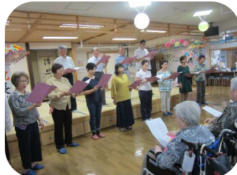
北上合唱アカデミー様