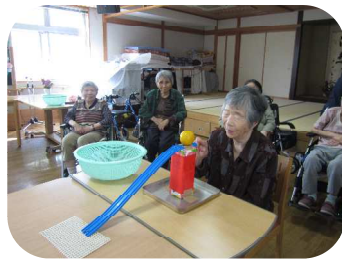
狙いをすまして集中力を高めて～