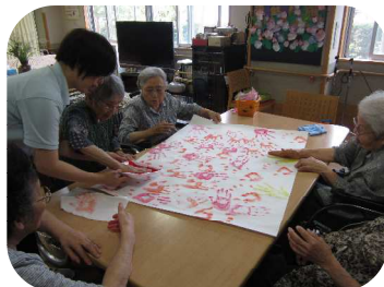
手形を取って飾りつけ～何に使うか楽しみ？