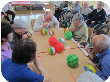
口腔体操で～す。フ～フ～

6月の一コマ～少しずつ薄着になってきました。五感を使った活動を多く取り入れました。